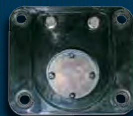
Модульные плоские клапаны